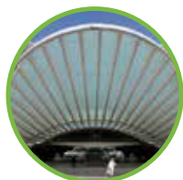
Proposal of venue

We support our clients and partners right from the beginning until the end of the event, in order to ensure the comfort and well-being of all the participants, suggesting custom-made solutions negotiated and contracted with long-term partners.