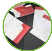
Design and creation exhibition stands