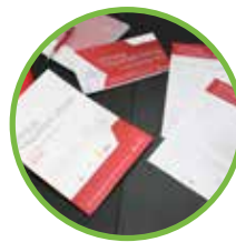
Branding, design and graphical materials