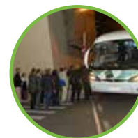
Transportation and Travels